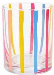
Gobelet en verre, H 8,8 cm. Primark, 2,50 €.

L ignes graphiques et esthétiques, les rayures n'ont pas leur pareil pour réveiller la déco. Et plus encore si on ose la couleur. Qu'elles soient larges ou fines, marquées ou plus discrètes, elles twistent immédiatement nos intérieurs. Verticales, elles donnent de la hauteur à une pièce. Horizontales, elles apportent de la profondeur. En diagonale, leur effet est hypnotique... mais pourquoi pas si on aime l'audace ? Cet été, on mise sur les tons très tranchés pour apporter de la bonne humeur. Sur un pan de mur (attention, point trop n'en faut) ou sur des accessoires, on a bon... sur toute la ligne. ●