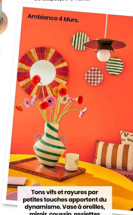
Tons vifs et rayures par petites touches apportent du dynamisme. Vase à oreilles, miroir, coussin, assiettes murales... transforment une pièce en tableau inspirant.