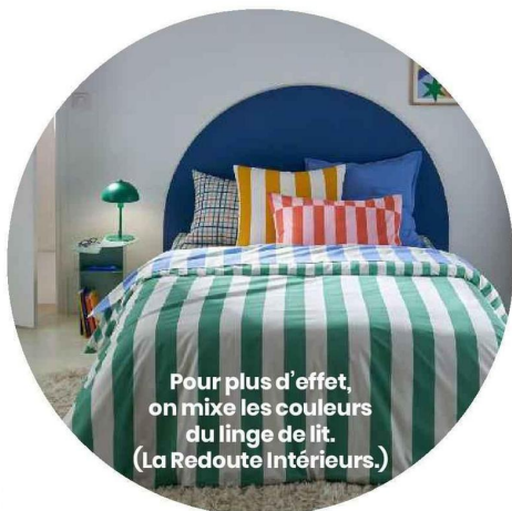
Pour plus d'effet, on mixe les couleurs du linge de lit. (La Redoute Intérieurs.)