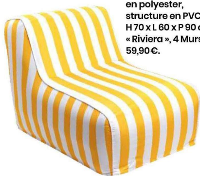
Pouf d'extérieur en polyester, structure en PVC, H 70 x L 60 x P 90 cm. «Riviera», 4 Murs, 59,90 €.