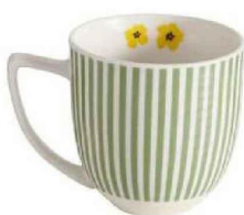
Tasse à café en porcelaine, H 13 cm. «Mayla», Gamm vert, 4,99 €.