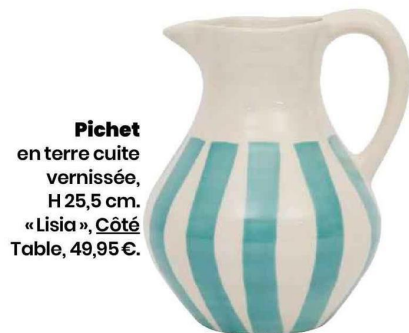
Pichet en terre cuite vernissée, H 25,5 cm. «Lisia», Côté Table, 49,95 €.