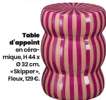
Table d'appoint en céramique, H 44 x Ø 32 cm. «Skipper», Fleux, 129 €.