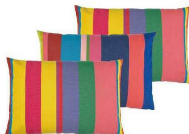
Housses de coussin 100 % coton. «Porto Rico», Tissage de Luz, 23,50 € l'une.