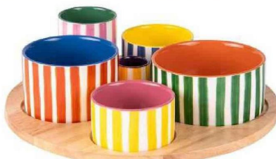
Set apéritif en céramique, plateau tournant en bois, Ø 31 cm. «Buenos Aires», Ambiance & Styles, 44,90 €.